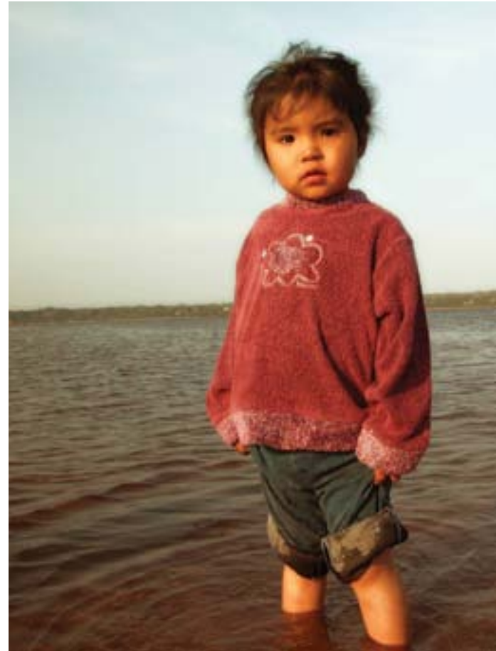
Jeune Innue.