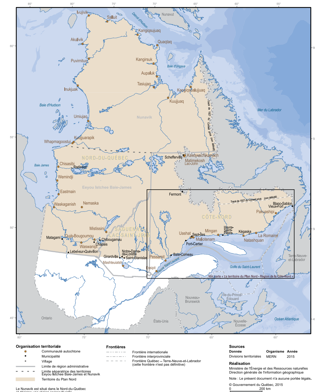
Carte 1 - Le territoire du Plan Nord