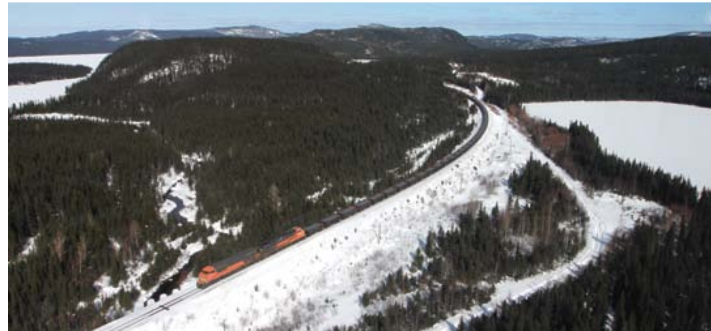
Chemin de fer de plus de 400 km reliant la mine de Mont-Wright aux installations portuaires de Port-Cartier.

Le financement de mesures et de projets d'infrastructures pourra être bonifié advenant une hausse de l'enveloppe disponible au Fonds du Plan Nord, laquelle est fonction de l'activité économique au nord du 49 e parallèle.