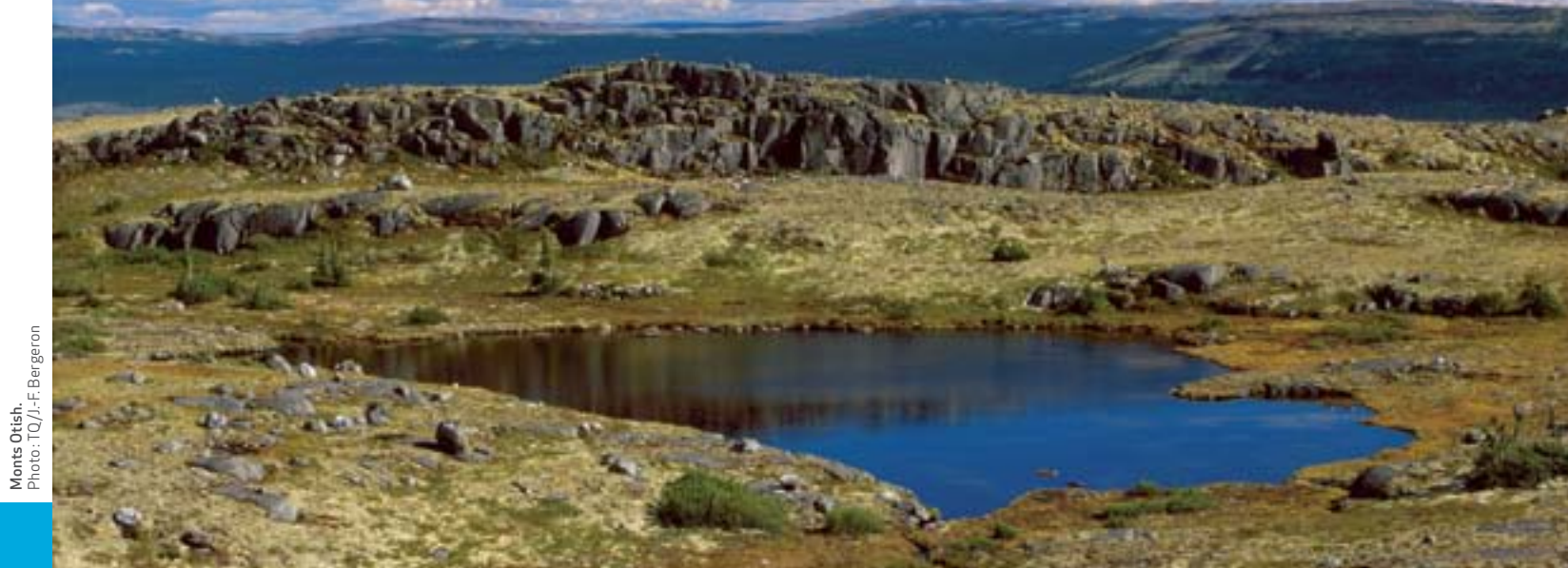
Monts Otish.