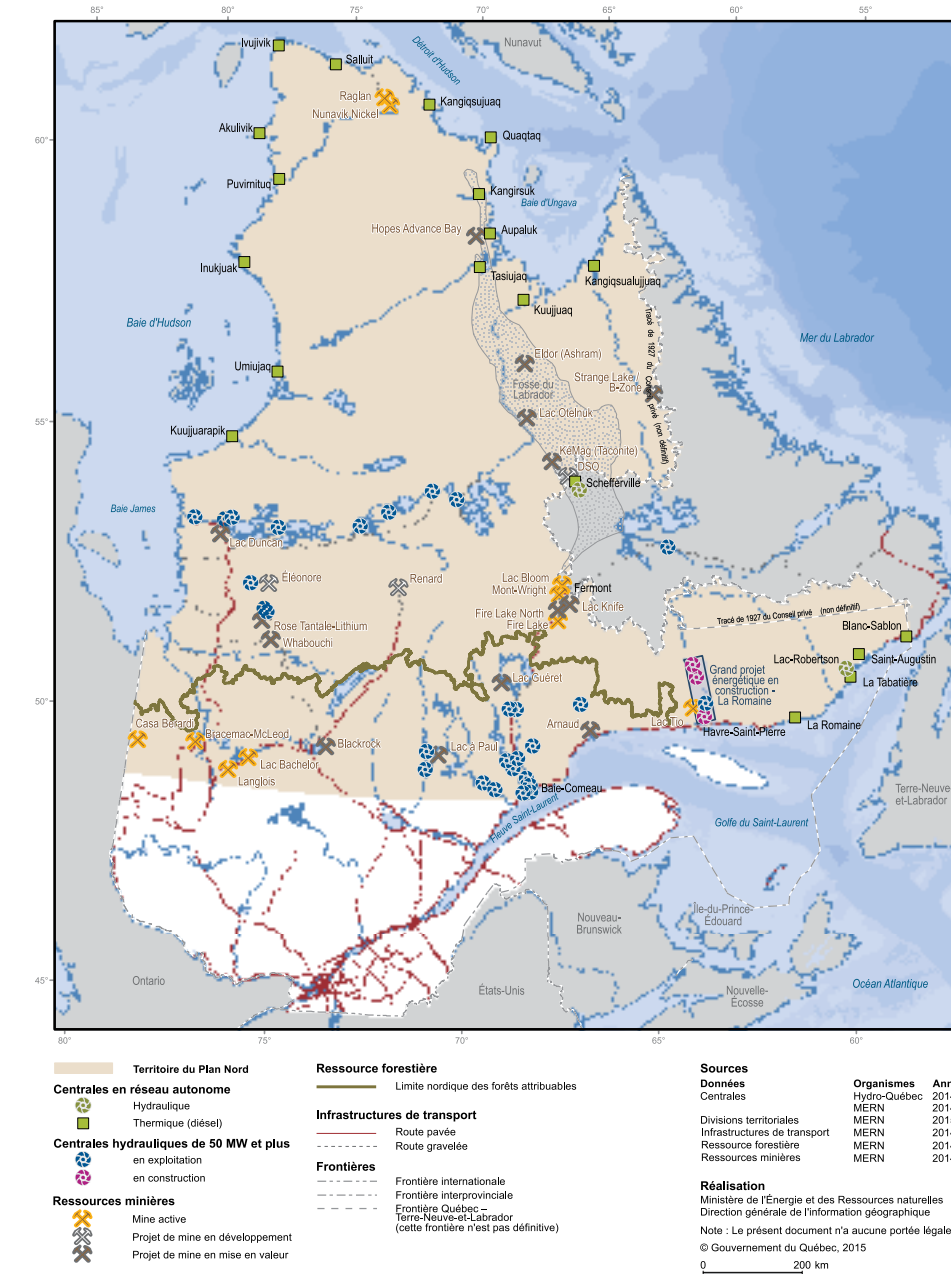
Carte 4 - Les ressources et les projets en territoire nordique