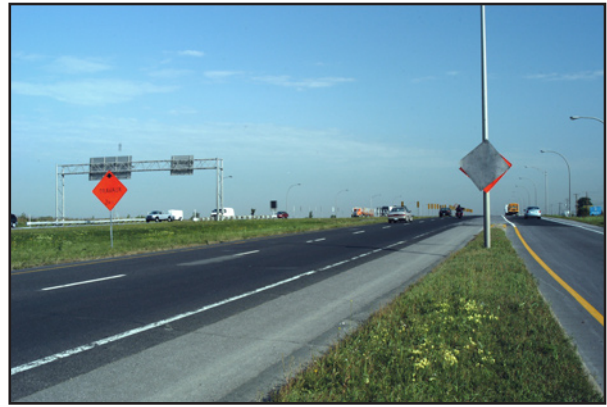
Le masquage est-il tombé ou a-t-il été oublié?