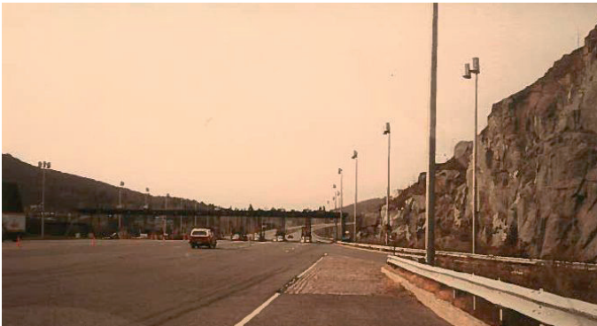
Photo d'archive d'un poste de péage situé sur l'autoroute 15

Le réseau routier québécois totalise environ 185 800 km de routes dont 29 000 km sont sous l'autorité de Transports Québec. Ce réseau supérieur est constitué d'autoroutes, de routes nationales, de routes régionales et de routes collectrices. Quoiqu'en pense l'utilisateur, le réseau autoroutier est encore bien jeune. La construction de la première autoroute remonte en mai 1956. Il s'agit du tronçon de 47 km qui relie Montréal à Saint-Jérôme. Lors de l'annonce de cette nouvelle route desservant les Laurentides, le premier