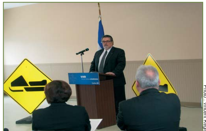
Monsieur Norman MacMillan, ministre délégué aux Transports, lors de l'annonce du projet du nouveau sentier récréatif, le 18 avril dernier.

Les travaux entourant ce projet débuteront au printemps 2012. Des activités de terrassement et la construction de structures sont au programme. « Une fois réalisé, ce projet viendra s'ajouter aux installations récréatives déjà en place dans la région. De plus, ce contournement assure une continuité au réseau actuel de motoneiges et s'inscrit dans la volonté de notre gouvernement de développer un sentier permanent de quads et de motoneiges », a affirmé M. MacMillan.