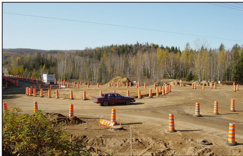
L'intersection de la route 327 et de la montée Ryan pendant la construction du carrefour giratoire (20 octobre 2004).

En plus d'avoir un attrait certain, cet aménagement paysager créera un obstacle physique important afin qu'il soit vu de loin par les usagers de la route arrivant à cette intersection. C'est en sorte un avertissement de la présence d'un carrefour giratoire, ce qui permettra aux conducteurs de diminuer leur vitesse.