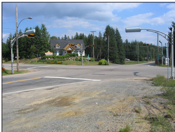
L'intersection de la route 327 et montée Ryan à ville de Mont-Tremblant avant la construction du carrefour giratoire.