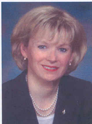
Julie Boulet Ministre déléguée aux Transports et ministre responsable de la région de la Mauricie

La ministre déléguée aux Transports et ministre responsable de la région de la Mauricie, madame Julie Boulet, sera de passage au motel Amosphère à Amos le mardi 21 juin afin de présider la consultation publique sur les véhicules hors route (VHR). « Cette consultation s'inscrit dans le cadre de la série de mesures annoncées en décembre dernier. Elle vise essentiellement à trouver