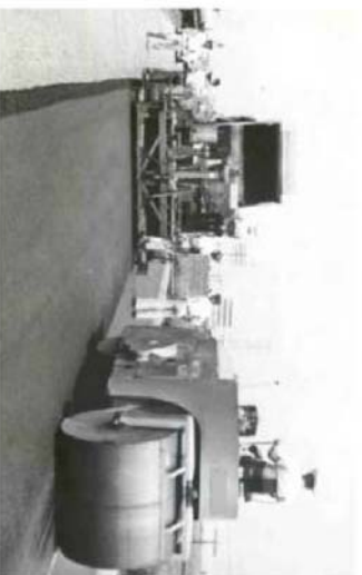
Un finisseur mécanique moderne se déplace sur la route laissant derrière lui un large ruban d'asphalte. Les rouleaux compresseurs au diesel rapides et manœuvrables ont remplacé les anciennes machines à vapeur munies de roues surelevées. Ce nouvel appareil de pavage était exposé en 1957 à la foire mondiale de l'industrie de la construction.