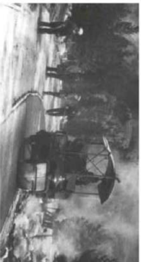
Premiers travaux de pavage commercial à l'aide de sables bitumineux à Jasper, en Alberta, en 1926.

En présentation du centenaire de l'ATC en 2014, la rubrique Un moment dans l'histoire relate des anecdotes historiques sur les événements importants du secteur des transports. Montréal sera l'hôte des célébrations du centenaire de l'ATC, ce sera l'occasion de se remémorer les réalisations importantes du Canada dans le secteur des transports.