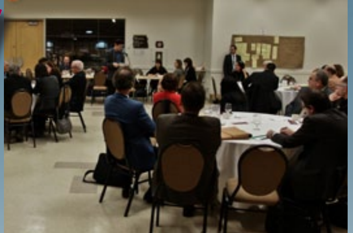
Les participants du PTMD en pleine action!

Ces mesures ont permis de réduire la quantité de gaz à effets de serre (GES) émis à 1,53 tonne. Pour compenser ces GES, Transports Québec s'est engagé à acheter des crédits de carbone, soit 22 arbres, lesquels seront plantés dans un projet québécois de reboisement.