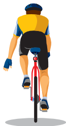
Ralentissement ou arrêt