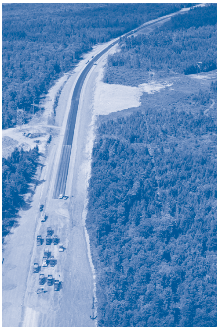
Travaux de prolongement de l'autoroute 73 entre Saint-Joseph-de-Beauce et Beauceville en 2005

Les travaux entrepris l'an dernier entre la rivière Calway et la rivière des Plante se poursuivront jusqu'en octobre. Par ailleurs, la troisième et dernière phase de ce tronçon permettant le prolongement jusqu'à la route du Golf à Beauceville a débuté. Les travaux consistent à construire deux chaussées à deux voies sur une distance de 2,3 km, de la rivière des Plante à la route du Golf à Beauceville, au réaménagement de la route du Golf et de l'intersection avec la route 173, ainsi que la construction de cinq structures, à savoir deux ponts au-dessus de la rivière des Plante, une structure au-dessus de la rivière Noire et deux ponts d'étagement au-dessus de la route du Golf. En tenant compte du déroulement des travaux, le Ministère vise l'ouverture de cette nouvelle portion d'autoroute jusqu'à Beauceville, soit une distance de plus de 13 km, pour la fin de l'année 2007.