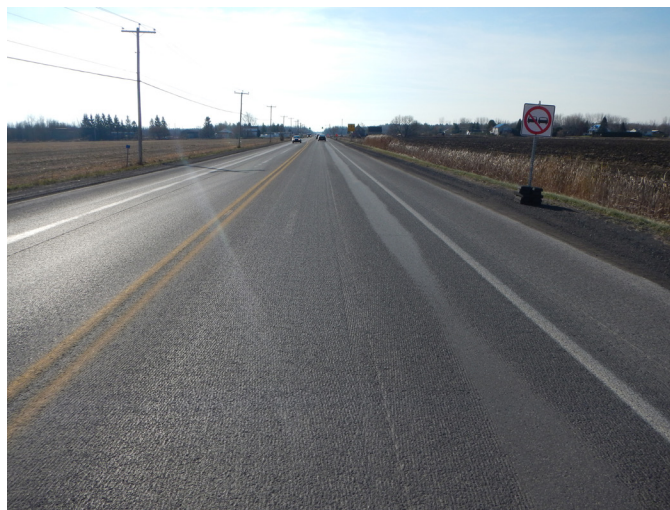
Figure 3 – Fond d'ornière laissé après planage fin pas assez profond

les quantités de résidus. À l'étape de la préparation d'un projet, une demande peut être formulée à la DLC afin d'effectuer les relevés nécessaires.