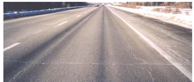
Photo 3 Ornières mixtes