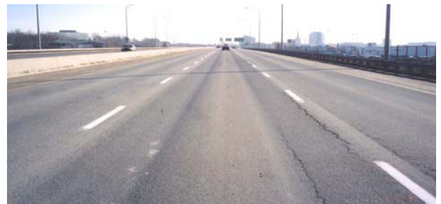
Photo 1 Ornières simples

Sur les 2 300 km de routes inspectées, trois types d'ornières à faible rayon ont été identifiés : ornières simples (une seule dépression dans les traces de roues), ornières multiples (dépressions multiples) et ornières mixtes (dépressions multiples dans une trace de roues et dépression unique dans l'autre). Les photos 1, 2 et 3 montrent les trois types d'ornières à faible rayon observées sur le réseau autoroutier. La répartition de celles-ci est indiquée au tableau 1.