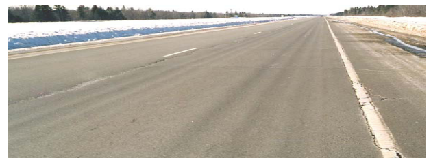
Photo 2 Ornières multiples