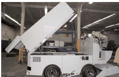
Surfaceuse pour la Ville de Pincourt

Le CGER a livré une surfaceuse de marque Zamboni à la Ville de Pincourt en novembre dernier et livrera son premier camion à ordures à chargement latéral à la Ville de Forestville à la fin de décembre.