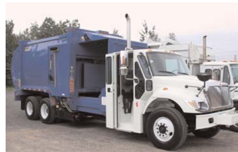
Camion à ordures à chargement latéral pour la Ville de Forestville

La commande d'un tel camion s'est faite chez l'entreprise Équipement Labrie Itée de Saint-Nicolas. Cette entreprise est reconnue comme étant un chef de file dans ce marché.