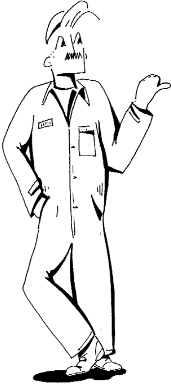
Source : TARDIF, Jean-François. « Le b-a ba de la conduite hivernale » Le Soleil, 27 octobre 2003