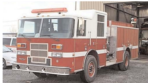
Camion de pompier de modèle Pierce livré à la Ville de Pincourt.

Ce camion de type autopompe a été commandé à l'entreprise Thibault & associés de Drummondville. Il peut aussi bien combattre les incendies avec de l'eau qu'avec de la mousse. De plus, quelques modifications ont dû être apportées afin de répondre aux exigences du client.