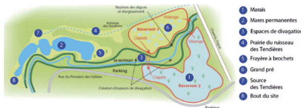
à une mosaïque de milieux