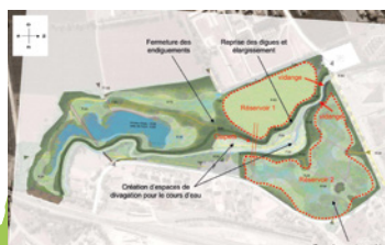
De réservoirs tampons...

Les milieux humides liés à un cours d'eau – prairies humides, anciens bras morts, anciennes gravières – peuvent constituer des zones d'expansion de crues. Leur présence réduit les débits à l'aval, allonge la durée des écoulements et permet de réguler les variations de niveaux du cours d'eau. La disparition des prairies, le drainage, le recalibrage des cours d'eau sont autant d'aménagements