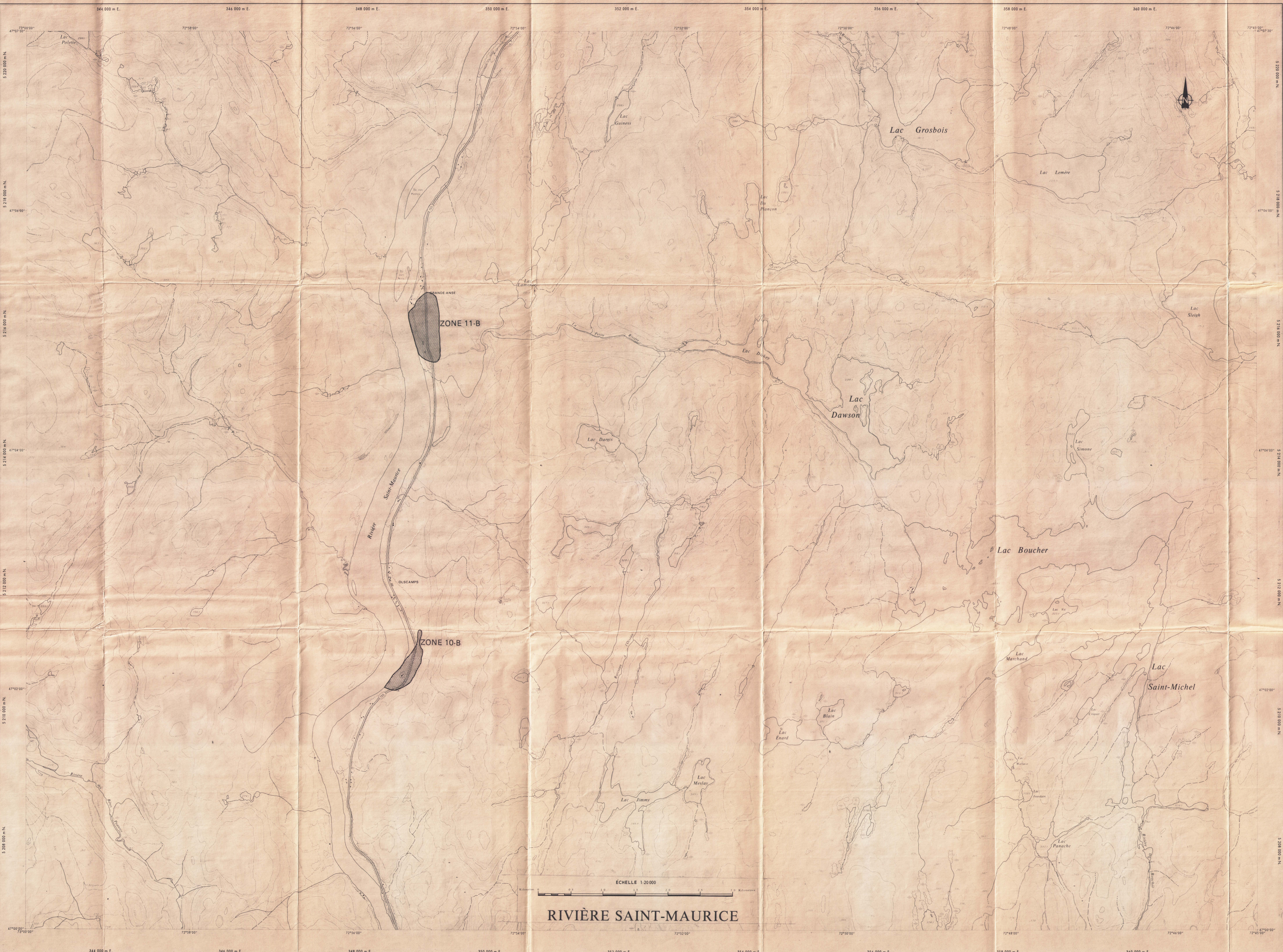
ECHELLE 1:20 000 RIVIÈRE SAINT-MAURICE