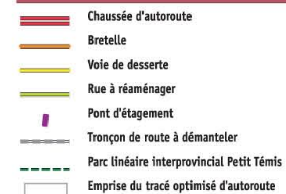
Figure 6.1 : Tracé optimisé d'autoroute du Nouveau-Brunswick à Dégelis (Tronçon 1)

Échelle 1:20 000 400 m 200 0 0,1 0,2 0,3 0,4 km