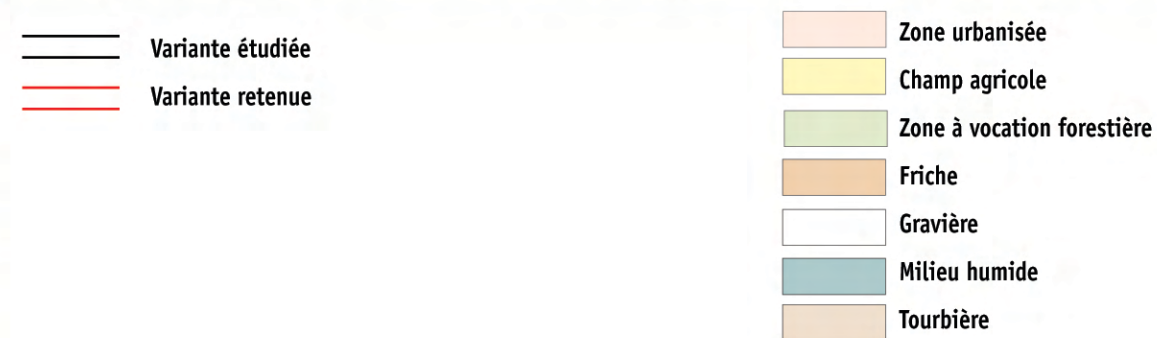
Figure 3.4 : Localisation des variantes d'autoroute étudiées, tronçon Notre-Dame-du-Lac/Cabano

Échelle 1:20 000 400 m 200 0 0,1 0,2 0,3 0,4 km