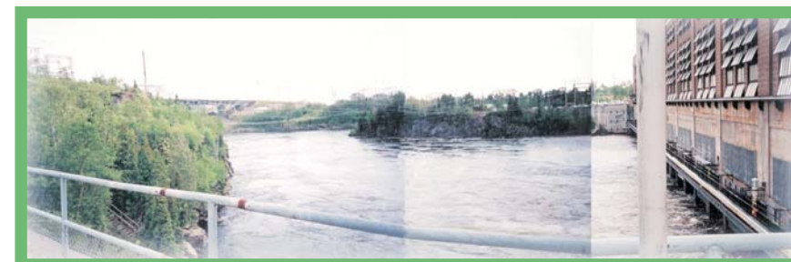
Concentration d'infrastructures sur la Grande Décharge: pont de la route 169, barrage, poste et ligne de transport d'électricité