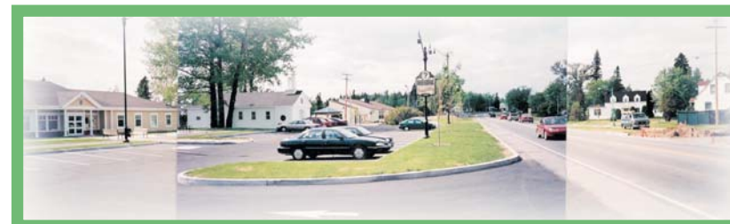
Promontoire bâti du côté ouest de la Grande Décharge, attrait visuel du noyau architectural aux abords de la route 169