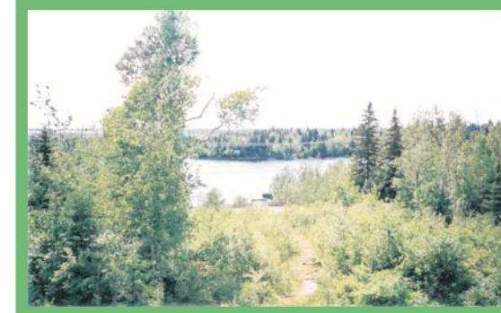
Paysage naturel de la Grande Décharge du côté sud du pont de la route 169