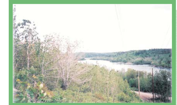
Paysage naturel de la Grande Décharge du côté nord de la route 169