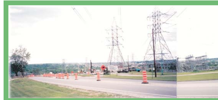
La Grande Décharge: concentration d'infrastructures