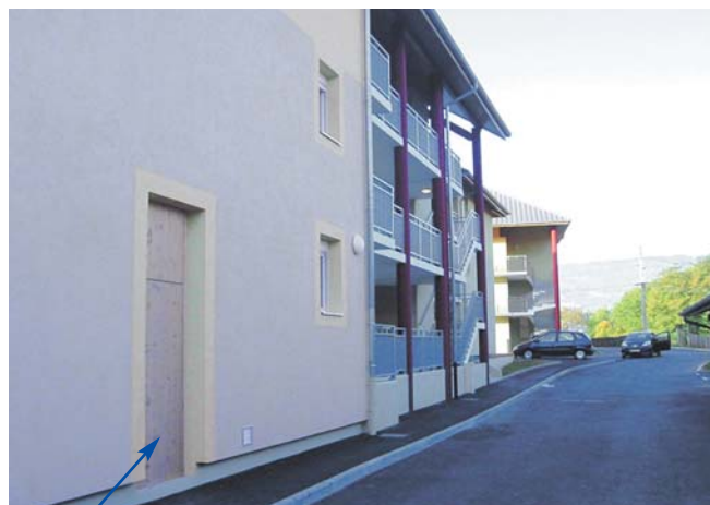
Accès au local vélos

Organisme gestionnaire : SAIEM de Chambéry.