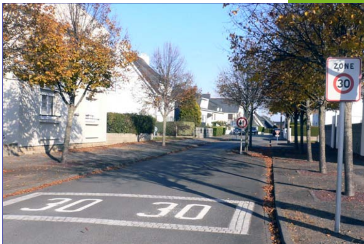
Les zones 30 sont quasiment systématiques dans les quartiers résidentiels

D'où la décision, en février 2005, d'inscrire dans le PLU l'extension de la zone 30 à tous les quartiers de Lorient. Une orientation très vite