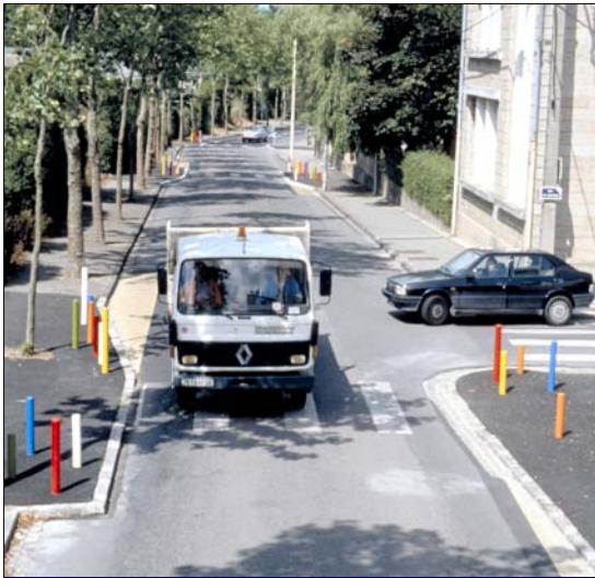
La priorité à droite est une règle simple et efficace pour apaiser les vitesses dans les quartiers