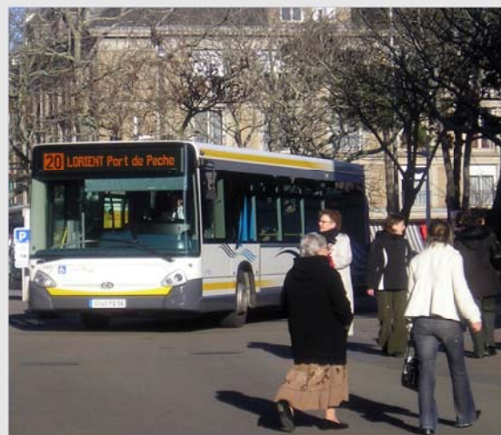
L'apaisement de la circulation et le contrôle du stationnement profitent aux piétons et à l'animation du centre-ville

Non seulement les personnes qui doivent se rendre au cœur de Lorient sont incitées à prendre les transports en commun (800 bus par jour desservent le centre-ville), mais on encourage les automobilistes à laisser leur voiture au parking (6 500 places de parking gratuit). D'une part, des zones de stationnement à rotation ont été installées à la périphérie, avec une visée clairement dissuasive. D'autre part, un stationnement gratuit est proposé dans l'hyper-centre pour limiter les flux des voitures en recherche de places. Cette politique du stationnement a abouti à une augmentation très sensible du nombre de piétons en ville. Pour encourager ce phénomène, la municipalité a d'ailleurs prévu la mise en place de panneaux qui les guideront sur des itinéraires adaptés, avec temps de parcours précisés. Mais toutes ces indications sont déjà disponibles sur des plans distribués dans tous les parkings.