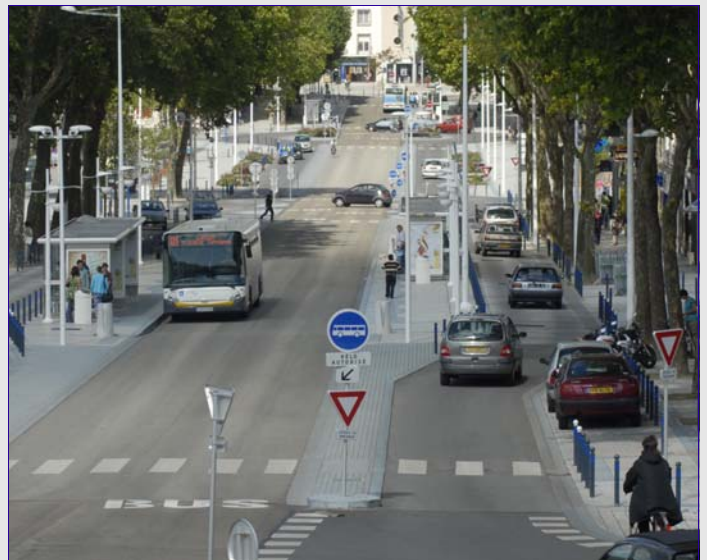
Avenue Anatole France, le respect de la zone 30 permet une cohabitation sans heurt

En centre-ville, cette inauguration a été précédée d'un réaménagement complet de l'avenue Anatole France. Des sept files de circulation qui existaient en 2001, il n'en reste plus que quatre, dont deux réservées aux bus qui disposent ainsi aux stations de quais confortables pour assurer la montée et la descente des voyageurs.