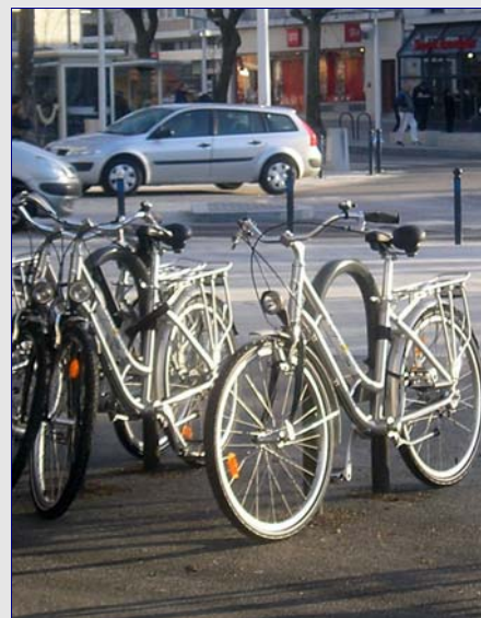
La généralisation des zones 30 accompagne le développement de l'usage des vélos

Les élus lorientais cherchent également à développer l'usage des modes doux sur les circuits côtiers : « pendant longtemps, explique Olivier Le Lamer, les espaces côtiers ont été occupés par la Marine, avec une base de sous-marins – aujourd'hui transformée en zone d'activité – et l'arsenal, dont certains espaces ont été rouverts aux Lorientais. Tout le circuit côtier, en lien avec la rade, est en phase de réappropriation. Un des objectifs de notre mandat est de retrouver ce trait côtier au travers de promenades piétons et cyclistes. »