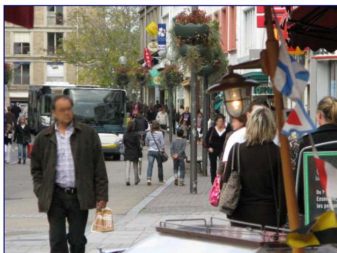
L'animation actuelle des espaces publics lorientais est le fruit d'une politique constante en faveur des modes doux et de la sécurité des déplacements

Cette situation provoque une réaction des élus : ils comprennent qu'il faut redonner aux personnes à mobilité réduite et, plus généralement, aux usagers vulnérables le droit de cité. Établir un partage plus équitable de la voie publique. Cela implique de limiter la primauté de l'automobile. C'est ce à quoi va s'attacher Lorient dès le début des années 1980. En 1985, la ville est même l'une des toutes premières à adopter un Plan de Déplacements Urbains (PDU). Dès cette époque, elle s'engage dans une démarche volontariste de développement des modes alternatifs (transports en commun, vélos) et de sécurisation des déplacements.