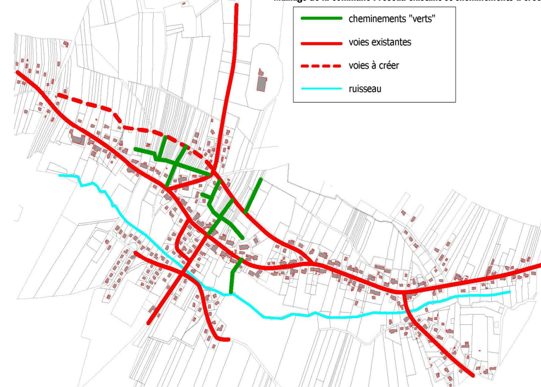
Maillage de la commune : réseau existant et cheminements à créer