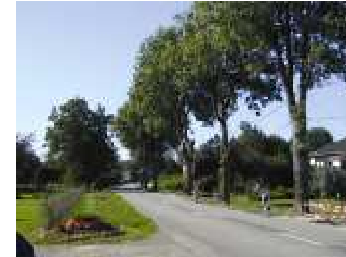
Traversée de village par la RD 13