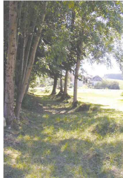
Exemple de cheminement