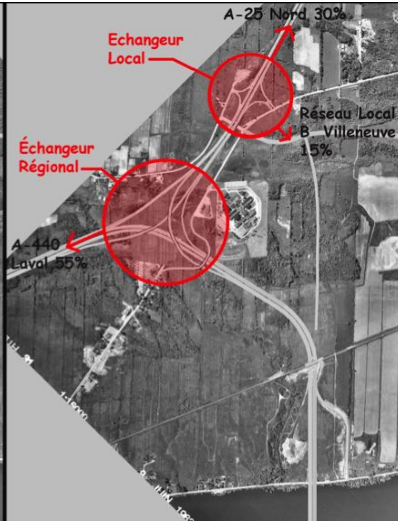
4- Version GRUHM (côté sud-ouest de la polyvalente) Révisée