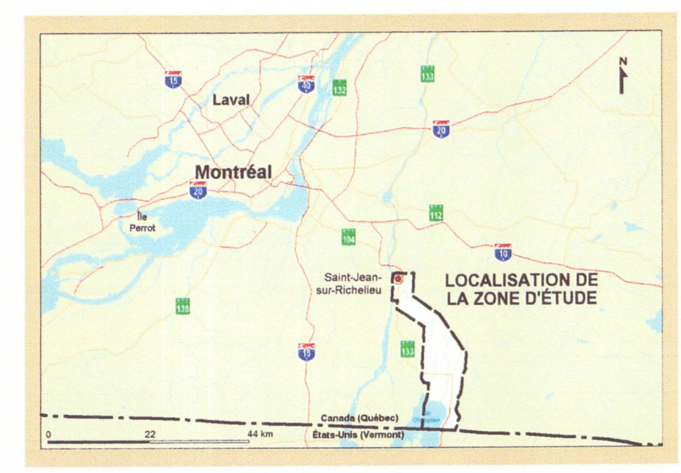
0 1 2 3 km 1:50 000

Sources : Base : BDTQ, 1 : 20 000 Faune à statut précaire : Société d'histoire naturelle de la Vallée du Saint-Laurent Centre de données sur le patrimoine naturel du Québec (CDPNQ) Banque de données sur les oiseaux menacés du Québec (BDMQ) GENIVAR Groupe Conseil inc., Beaulieu et Huot (1992), COSEPAC Flore à statut précaire : GENIVAR Groupe Conseil inc., Consultants S.M. (2003) Centre de données sur le patrimoine naturel du Québec (CDPNQ) Société de la faune et des parcs (2002) Inventaires : GENIVAR Groupe Conseil inc., Étude des populations d'oiseaux du Québec (EPOQ), Papineau (2003)