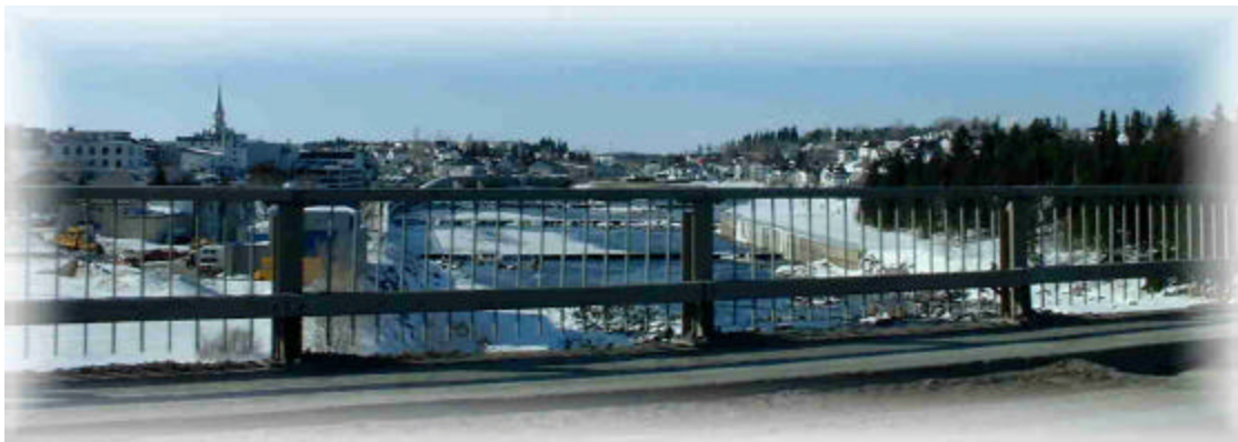
Vue du pont, Alma

Les moyens d'action prévus touchent le transport des personnes et des marchandises ainsi que les infrastructures de transport. Les moyens d'action relatifs à certaines infrastructures récréotouristiques, comme les sentiers de véhicules hors route (motoneiges et quads), n'ont toutefois pas été abordés puisqu'il s'agit surtout d'activités de loisirs. Cependant, le volet sécurité de la pratique de ces activités a été traité et des moyens d'action ont été définis.